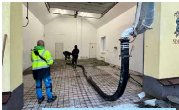
Betonování podlahy v tem. hasičárně.