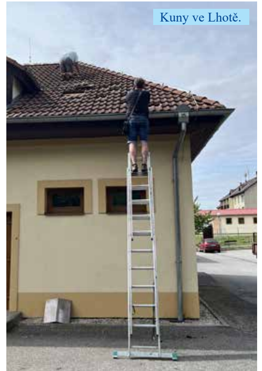
Kuny ve Lhotě.