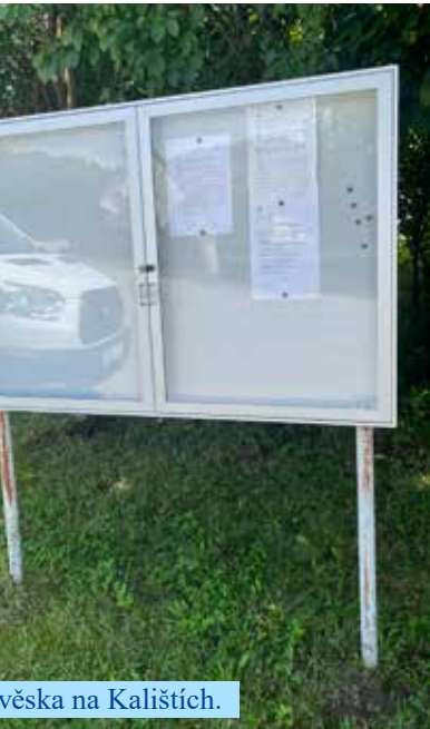
Nová tabule na Kalištích.