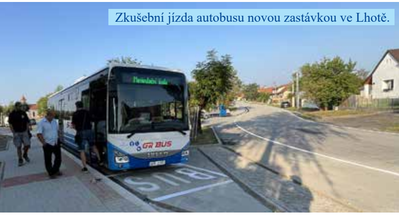
Zkušební jízda autobusu novou zastávkou ve Lhotě.