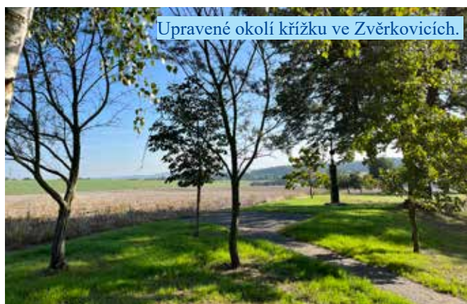
Upravené okolí křížku ve Zvěrkovicích.