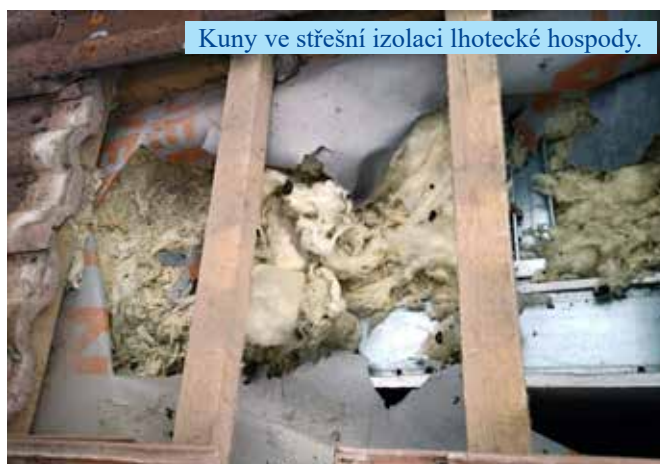
Kuny ve střešní izolaci lhotské hospody.