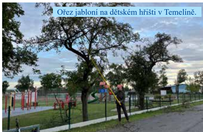
Ořez jabloní na dětském hřišti v Temelíně.