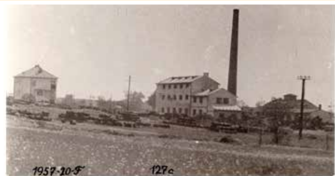
IV. pamětní kniha obce Temelína 1953 - 1956, (roh)

Po dalším projevu vedoucího vyplnila hudba program až do hodin odpoledních, kdy byla slavnostní prohlídka závodu. Na čele s hudbou ubíralo se v trojstupech celé množství silničářů od hostince Jednoty k postavenému závodu. Zde byl výklad. Tovární budova sestává se ze tří oddílů. Kotelny, varny a mlýna drcení asfaltu. Poté se šlo zpět do hospody, kde pokračoval program a různé přednesy, referáty, agitace a projevy i děkovaní. Poté se rozproudila veselá zábava, jíž se účastnilo i občanstvo obce Temelína až přes půlnoc.