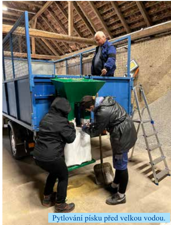
Pytlování písku před velkou vodou.