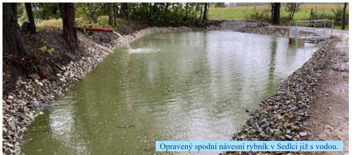
Opravený spodní návěsní rybník v Sedlci již s vodou.