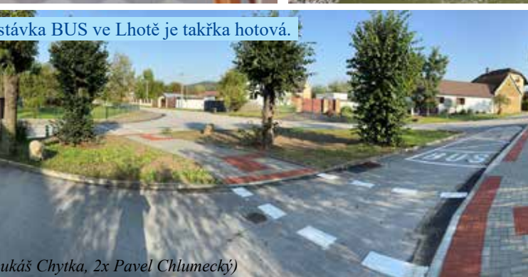
Nová zastávka BUS ve Lhotě je takřka hotová.