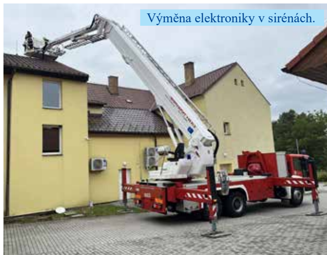
Výměna elektroniky v sirénách.