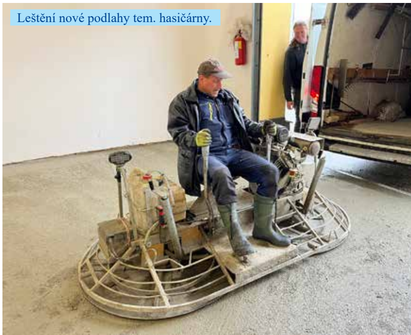
Leštění nové podlahy tem. hasičárny.