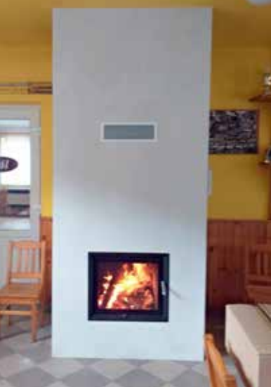
Nová tabule ve lhoteckém výčepu.