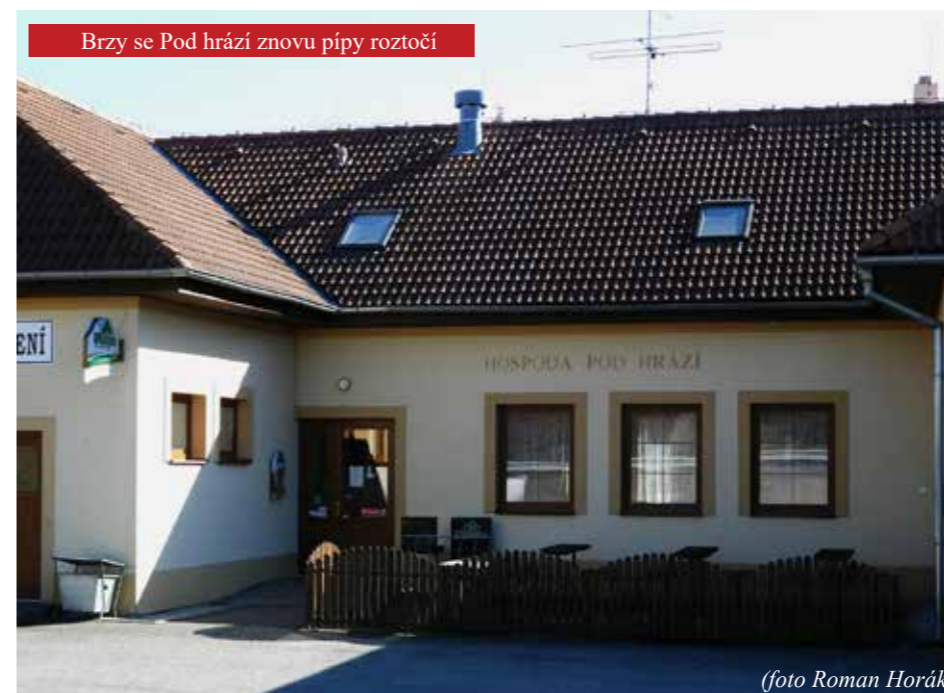
Brzy se Pod hrází znovu pípý roztočí

Je nutné si přiznat, že se sešlo několik negativních faktorů, které přispívají obecně k tomu, že se vesnické hospody netěší přílišnému zájmu kvalitních nájemců. Covid s gastronomickým odvětvím notně zamával. V současné době ránu do vazů výčepních zasadilo skokové zvýšení ceny energií. Problémem naší temelínské hospody je také její zastaralost. Dlouhá léta je snaha o její rekonstrukci, bohužel ta se nachází pouze v přípravných pracích na projektech. Takže ještě chvíli se o ní