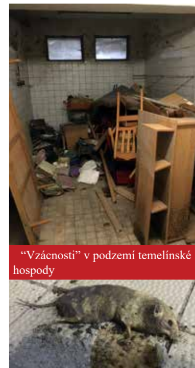
„Vzácnosti“ v podzemí temelínské hospody

Nyní jsou všechny inkriminované prostory opět prázdné, a tak jsme se tam s paní Sládkovou vydali na malou exkurzi, o které vám dáme vědět