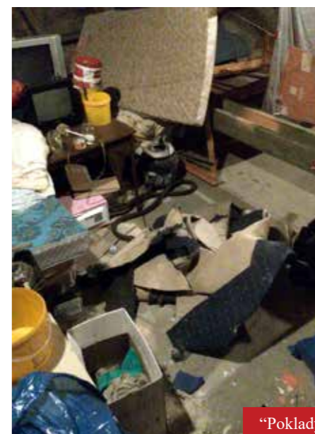
„Poklady“ z temelínské půdy

příště. Dále nezbyvá než doufat, že se najde ještě nějaký provizorní nájemce, než bude možné započít vytoženou rekonstrukci.