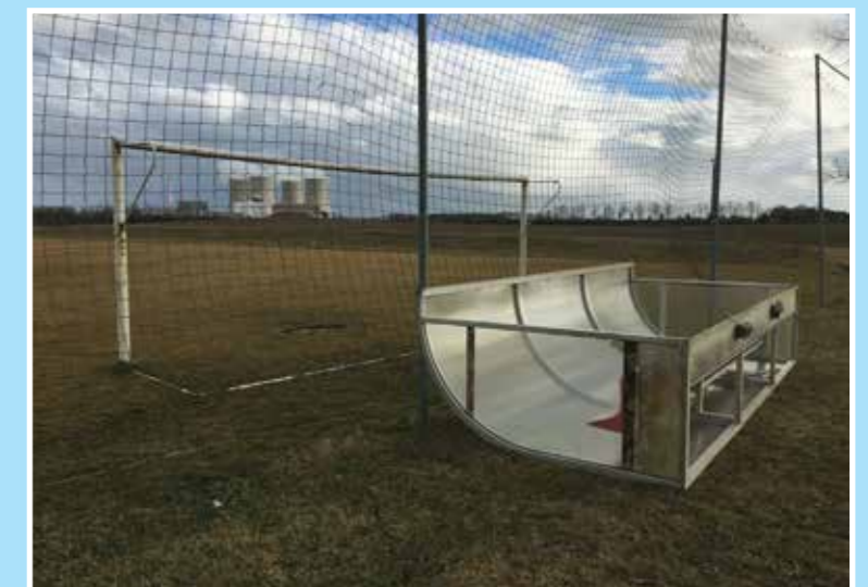
Utržená střídačka TJ Slavoj Temelín