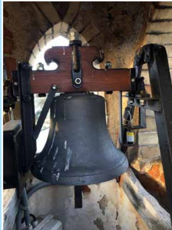
Zvon zvěrkovické kaple