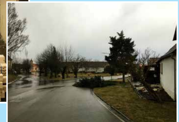
Následky mimořádného víchru 17. února (Lhota)