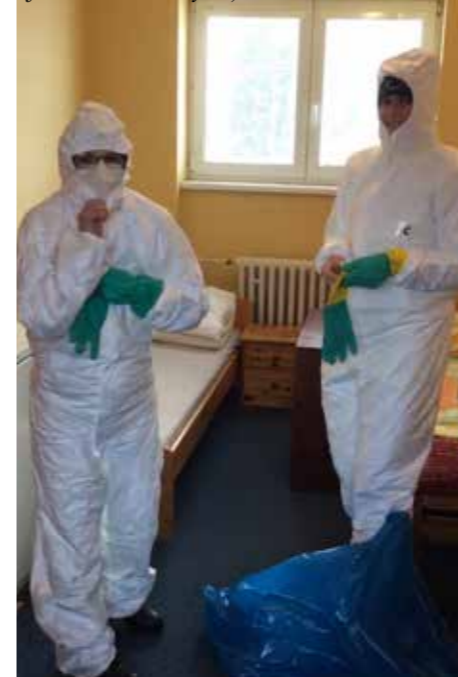
Známa ochrana proti covidu byla nutná při úklidu nepořádku

situace – akutně musela shánět někoho, kdo by hospodu vedl alespoň provizorně.