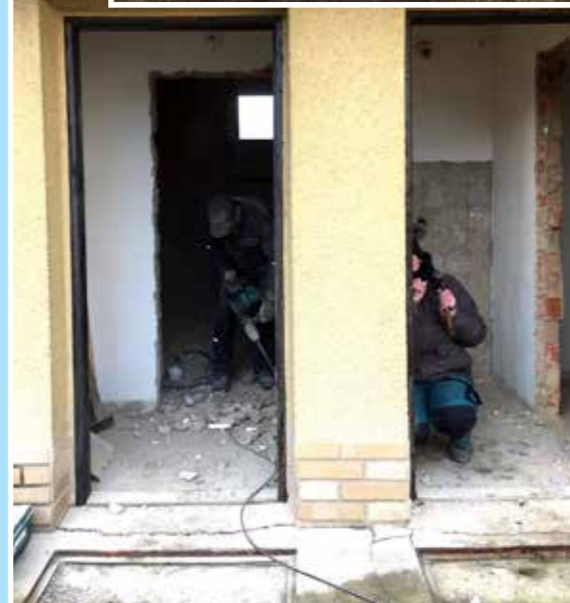
Orloukání hřbitovního WC