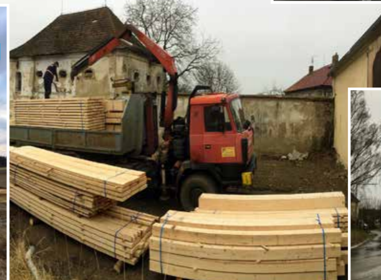
Trámy na špýchar