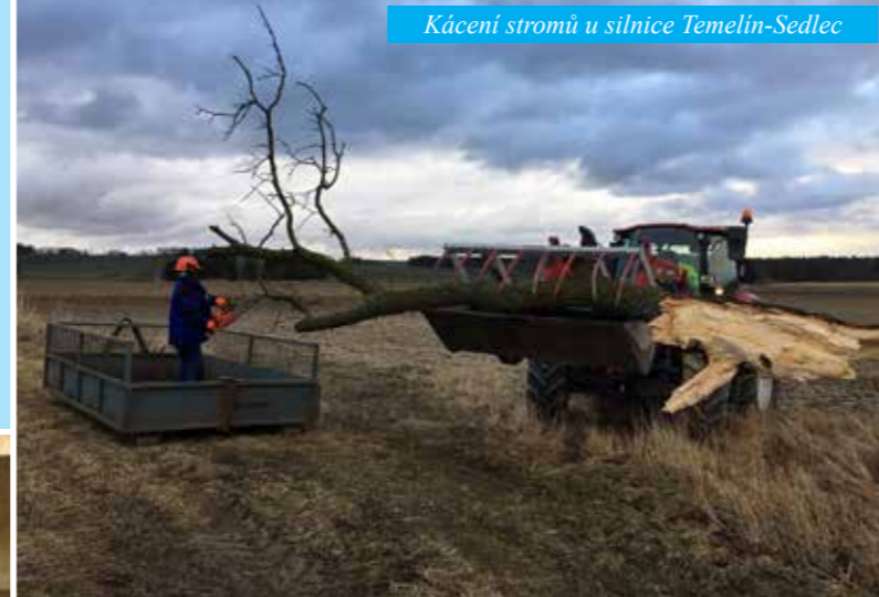
Kácení stromů u silnice Temelín-Sedlec