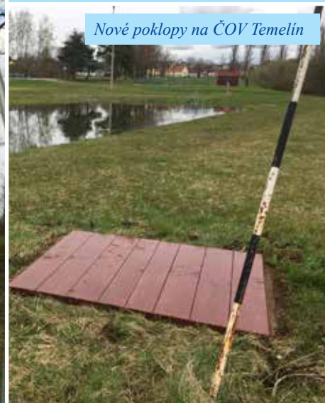
Nové poklopy na ČOV Temelín