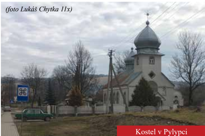
Kostel v Pylypci