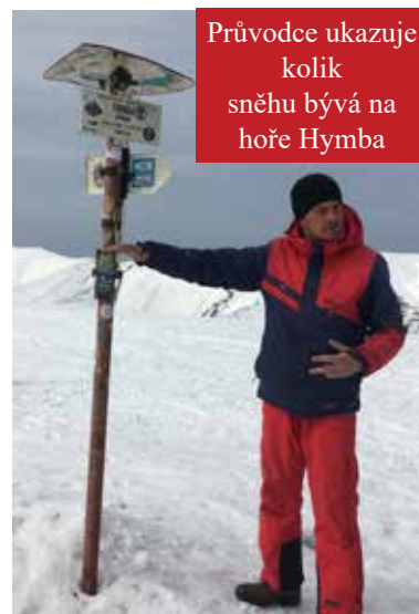
Průvodce ukazuje kolik sněhu bývá na hoře Hymba

Pylypetský úřad je zvenku poměrně malá nenápadná budova. Nebýt vstupu ve žlutomodrých barvách a plachty s nápisem „Pylypetská hromada“ pověšené na zábradlíčku balkonu nad vchodem, cizí člověk by jej snadno minul. Uvnitř je to ovšem úplně jiný svět. Po pár minutách pobytu