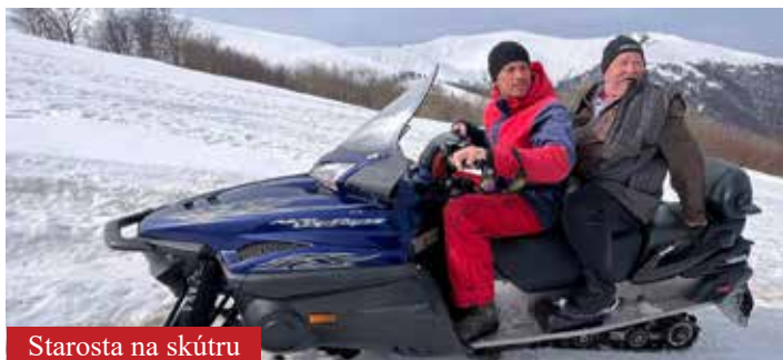
Starosta na skútru

Po čtvrt hodině jsme zastavili na odpočívadle u silnice za Užhorodem, abychom si vychutnali úlevu a kousek svačiny. V hotelu nás čekají v 7 s večeří a cesta od hranic trvá dvě hodiny, to bychom měli v pohodě stihnout. Vyrazili jsme a pohledem hltali okolní krajinu. Připadalo nám zvláštní, jak je pustá a silnice vlastně taky, na to, že jde o hlavní tah od hranic. A lepší kvalita, než u nás? Silnice III. třídy ze Lhoty pod Horami na Sedlec je proti tomuhle luxusní dálnice. Alespoň tedy výmoly mívají naši cestáři většinou zalepené, případně to mají v plánu. Zde však výmolů přibývalo, a naopak razantně ubylo aut i lidských obydlí. Pokud už něco jelo proti, bylo to buď SUV nebo žigul. Když jsme pak narazili na již několikátý výmol v podobě půlmetrového schodu přes celou šířku vozovky, na mysl nám vytanula Jurova včerejší slova: „Ta silnice má jediný nedostatek –