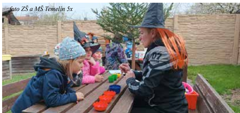
foto ZŠ a MŠ Temelín 5x