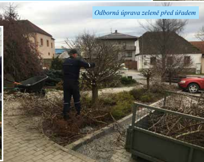
Odborná úprava zeleně před úřadem