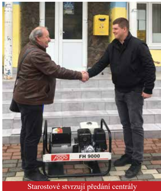
Starostové stvrzují předání centrály

Kvůli klidnějšímu provozu jsme vyrazili v neděli o čtvrté ranní směr Brno, Uherské Hradiště, Starý Hrozenkov, Trenčín, Žilina, Liptovský Mikuláš, odpočívadlo Štrba s Gerlachovským štítem jako na dlani, Poprad, Prešov, Košice, Dargov, Sečovce, Michalovce, Vyšné Nemecké. Ve 14:30 jsme dorazili k přechodu. Slovenská paní celnice si převzala naše pasy, zapsala stav tachometru, paliva, počet členů posádky, a vyrazila zkontrolovat zavazadlový prostor. Při pohledu na českou cenovku nalepenou na centrále suše pronesla: „Koľko je to euro?“ „Asi dva tisíce.“ „Môžete viesť iba do tisíc euro. Kde od toho máte doklad?“ „Nemáme. Ale tady máme papír, že jsme Obec, já jsem starosta a vezeme to do školy na Ukrajině.“ „Mala by som vás poslať späť.“ Ale neposlala. Naše lehkovážnost nám tentokrát prošla a mířili jsme k ukrajinské kontrole. To