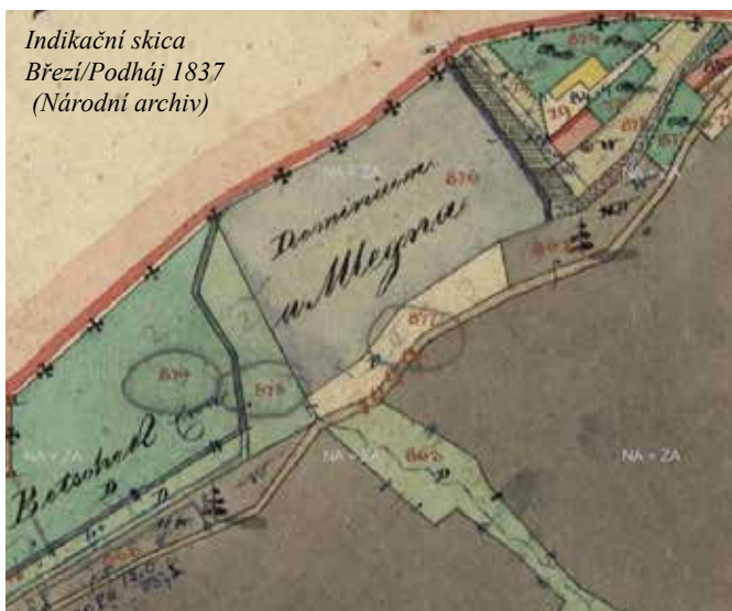
Indikační skica Březi/ Podháj 1837

Prvně nám se připomíná v roce 1708 jako mlýn na nestálé vodě u Palečka, v „Dějínách města Týna nad Vltavou a okolí“ (díl druhý, století osmnácté) Josef Sakař píše, že „na panství Hrádku Vysokém stál mlýn jeden s úrokem 6 zlatých“. Zdejší mlýn a mlynáři jsou již přes 200 let nerozlučně spjati s osudy a příjmením Boček. Mlýn byl emphyteutický, tzn. s omezeným vlastnickým právem, platil se v něm dědičný pacht. 30. srpna 1888 způsobila letní bouřka s průtrží mračen a krupobitím rozvodnění potoka Paleček. Mlýn čp. 19 a sousední země-