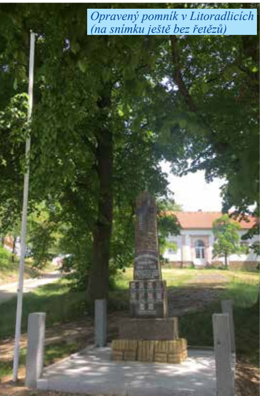
Opravený pomník v Litoradlicích (na snímku ještě bez řetězů)