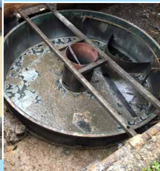
ČOV lhotecké hospody před zásahem