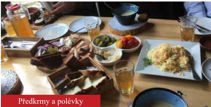
Předkrmy a polévky

Proběhlo oficiální předání darované elektrocentrály s patřičnou fotodokumentací a celou věc stvrdili starostové svými podpisy. Naše výprava následně jako další z mnoha výrazů