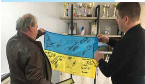
Vlajka s podpisy vojáků