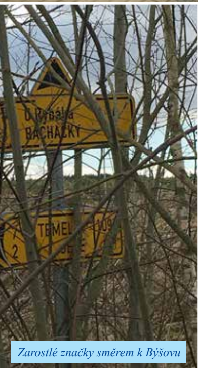
Zarostlé značky směrem k Býšovu