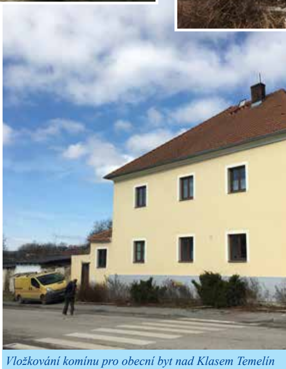
Vložkování komínu pro obecní byt nad Klasem Temelín