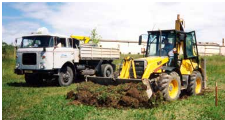
Stavba DPS, první kopnutí do země, 1998.

Stavba byla zahájena v červnu 1998, slavnostní otevření pak proběhlo v březnu o dva roky později. Od té doby