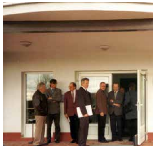
Otevření DPS Temelín v březnu 2000.

a blízkého okolí. Sociální služby zde poskytují Domovy K L A S, které sídlí v Temelíně čp. 15, v objektu DPS působí dvakrát týdně praktický lékař a na-